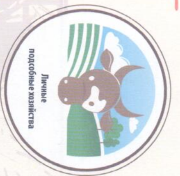
Личные подсобные хозяйства