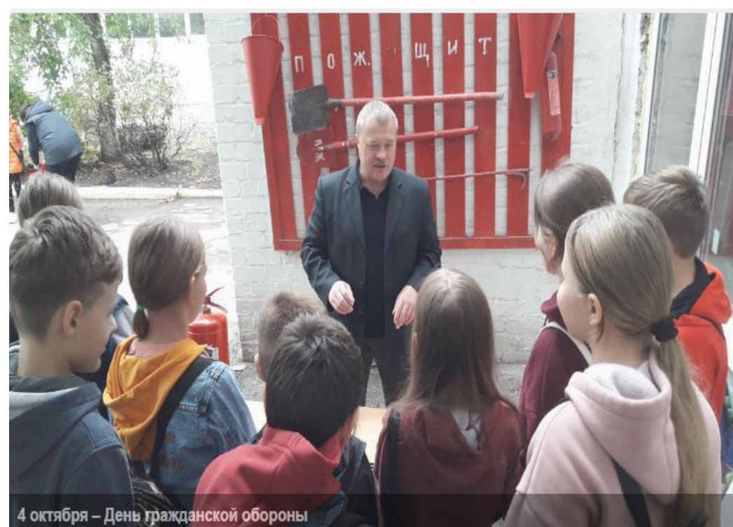
4 октября – День гражданской обороны